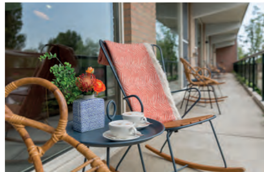
Terras Luxe kamer