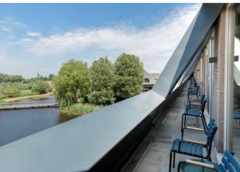
Terras Luxe kamer